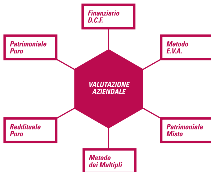
I Metodi valutazione